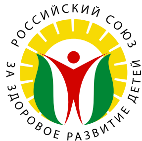
Российский союз за здоровое развитие детей